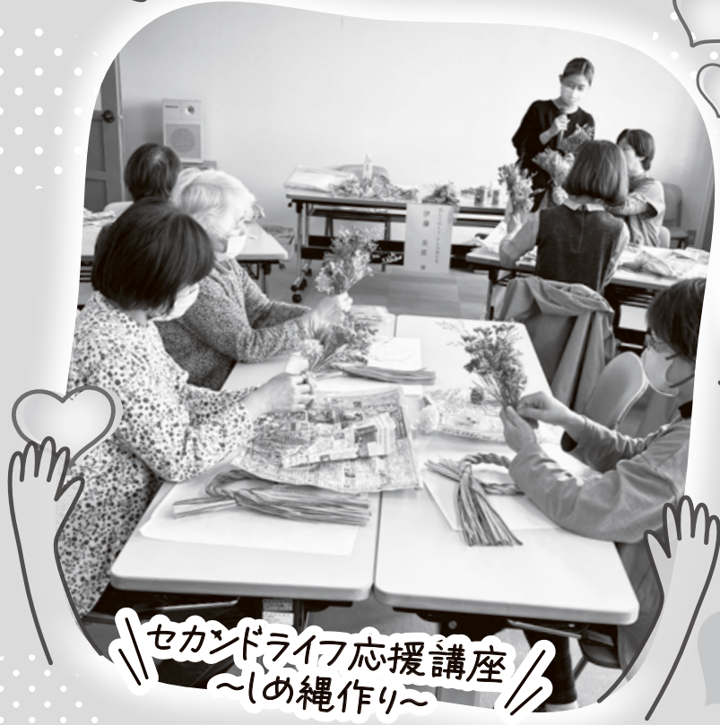
セカンドライフ応援講座 ～しめ縄作り～