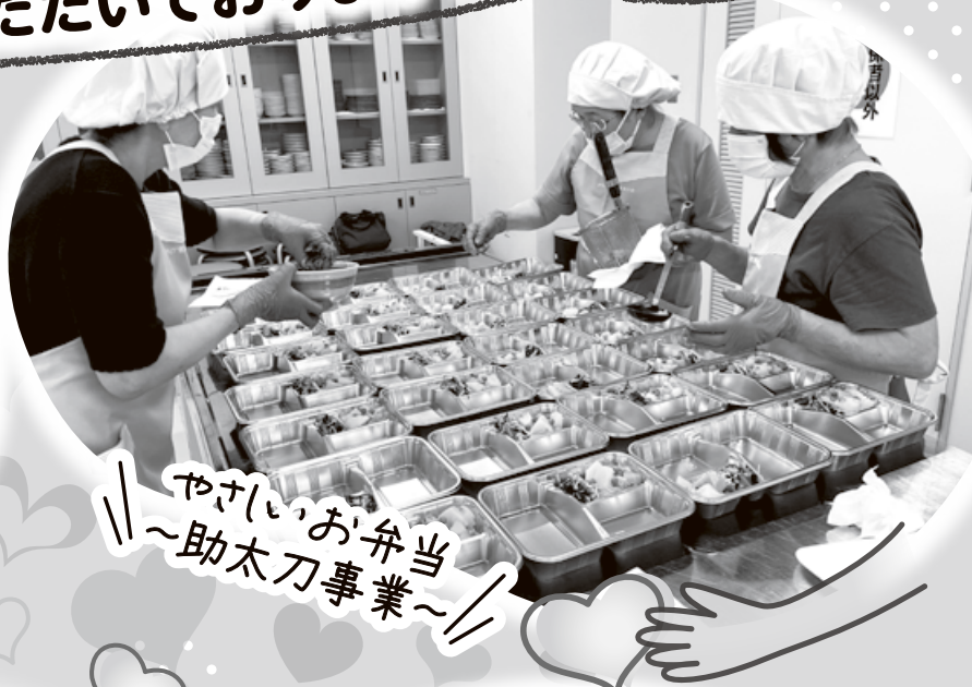
やさしいお弁当 ～助太刀專業～