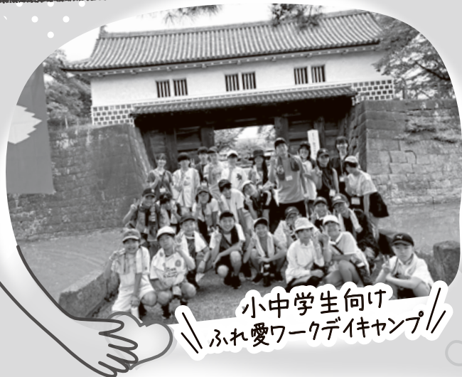
小中学生向け ふれ愛ワークデイキャンプ