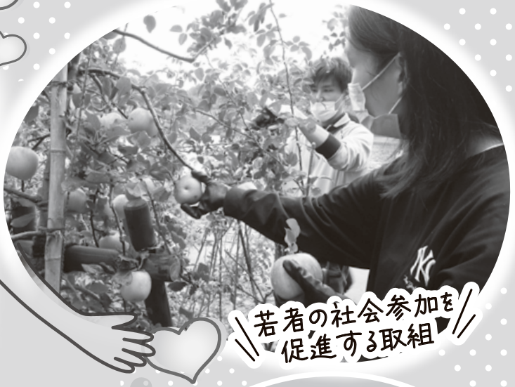
若者の社会参加を 促進する取組