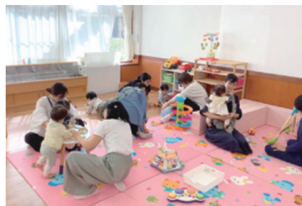
子育て支援センターの様子