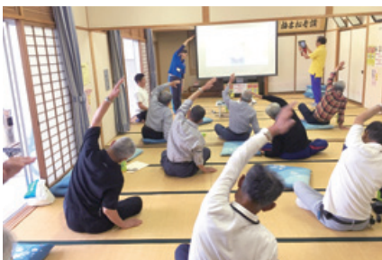
ふれあい いきいきサロン