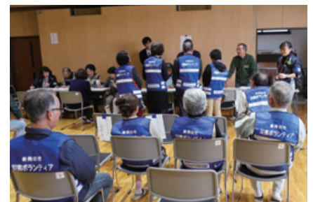
災害ボランティアセンター設置訓練