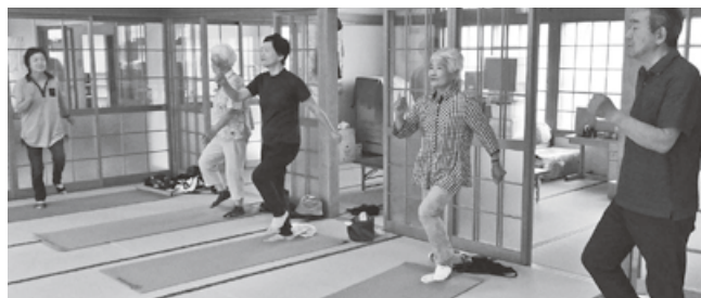
①ふれあい・いきいきサロン