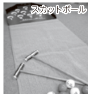
②レクリエーション用具貸出事業